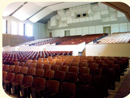
講堂 1000人収容できる広さ