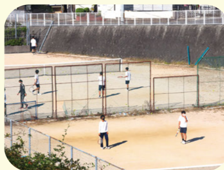
テニスコート 4面あり授業でも使用