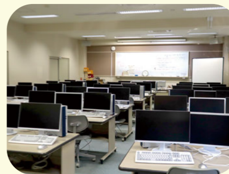
国際情報ルーム PC教室が2つ