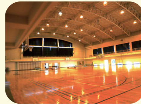
体育館 2階には卓球場も