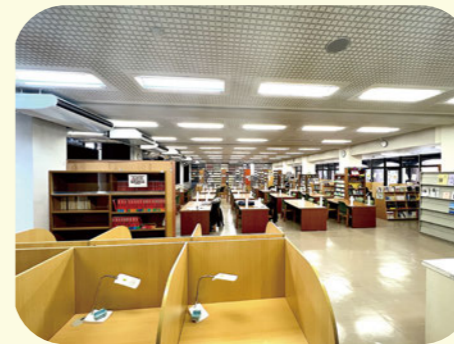
図書館 自習室としても利用可能