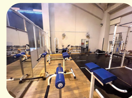
トレーニングルーム 部活動などで活用